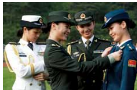
试穿军服的女军官

武警警服包括：春秋常服为橄榄绿色，夏常服为浅橄榄绿色，冬常服为深橄榄绿色，作训服为通用迷彩和数码荒漠迷彩。