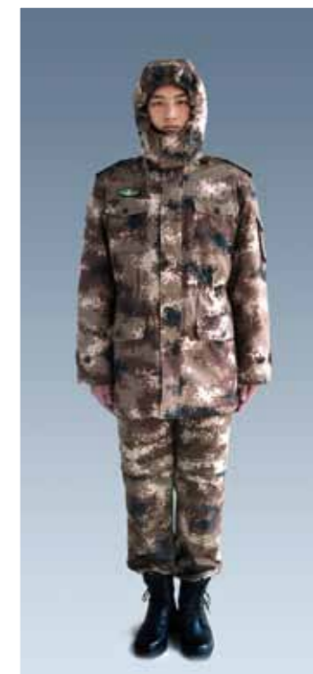
陆军冬季迷彩作训大衣