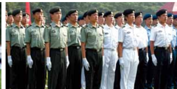
身穿夏常服的士兵